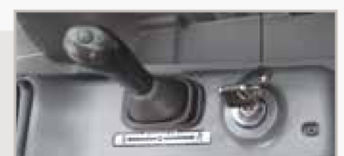
Interruptor de modo de desplazamiento y función de flotación de la hoja dózer