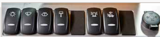
Mandos de la derecha