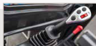
Joystick proporcional con mando integrado auxiliar